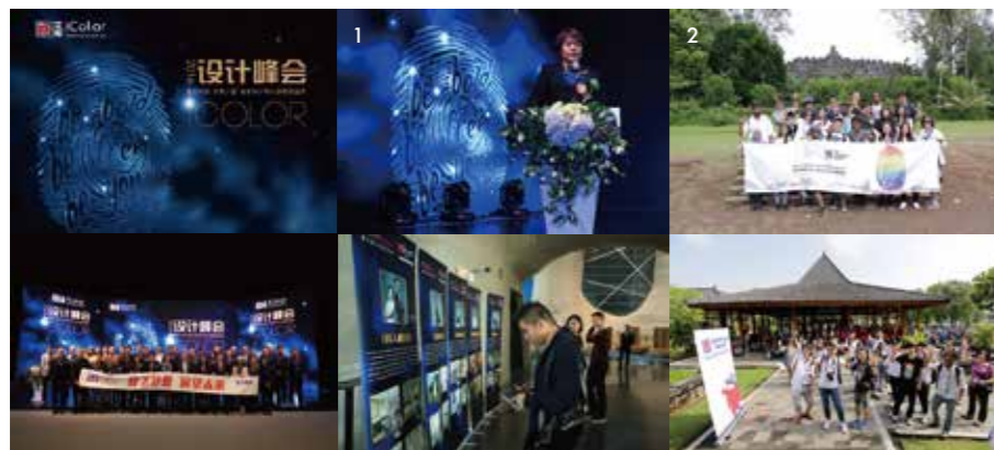
1.日本建筑大师本间贵史发表主题演讲 2.AYDA亚洲青年设计师大赛