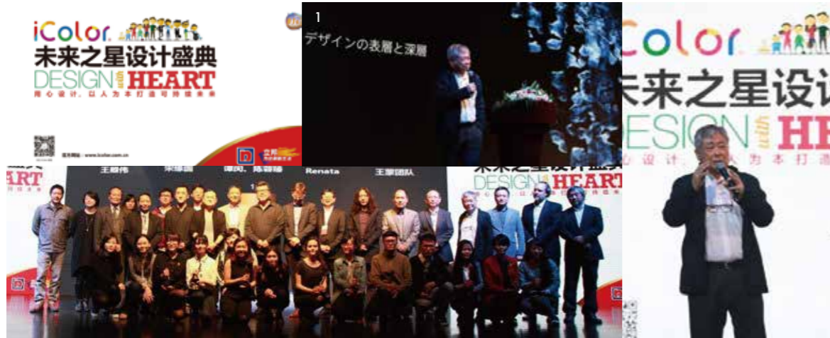
1.黑川雅之 担任评委会荣誉主席并现场演讲