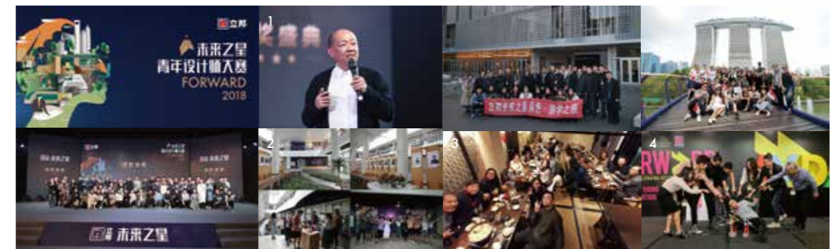
1.国际著名华人设计师—卢志荣先生分享《BEYOND》主题演讲 2.夏令营 3.采色·游学之旅(日本) 4.AYDA亚洲青年设计师大赛